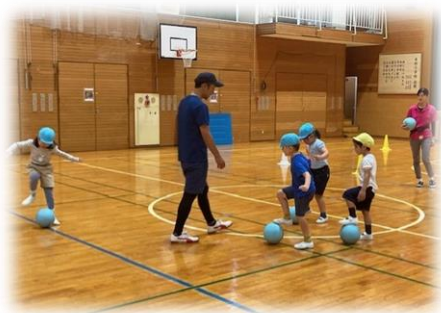
月2回の「ボール遊びの会」