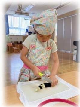
収穫したナスを包丁で切る体験や、誕生会おやつ・パンケーキ作り