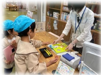
絵本を借りたり返却したりする体験