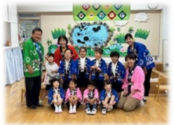
ほんむらまつり集合写真