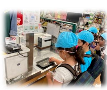
子供だけで支払いをする体験