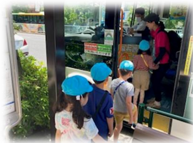
ちいばすを利用した散歩体験