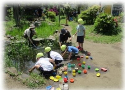
ビオトープでのオタマジャクシ集め