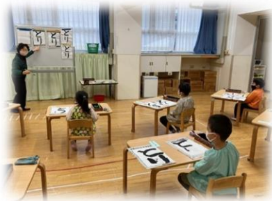
毛筆・墨を使った「書道教室」