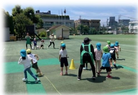
近隣保育所との交流活動（助け鬼）