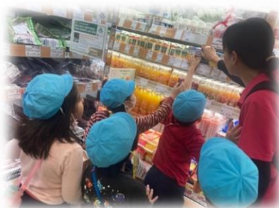
近隣スーパーへの買い物体験