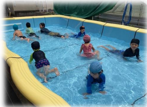
少人数でのびのびプール遊び