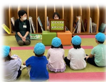
麻布図書館「おはなし会」参加