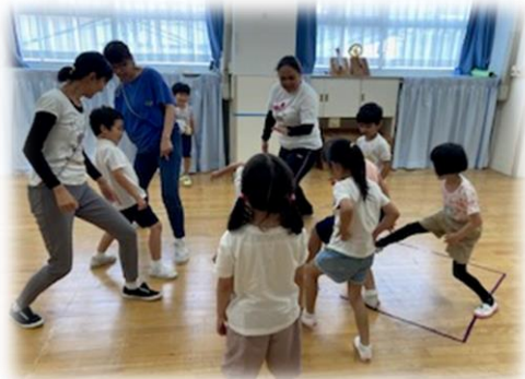
4歳・5歳の学年の壁はなく、みんな友達