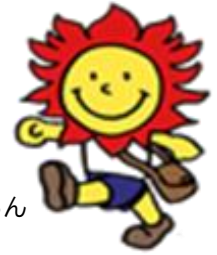
マスコット ほんむらん