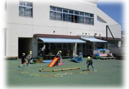
園庭でのサーキット遊び