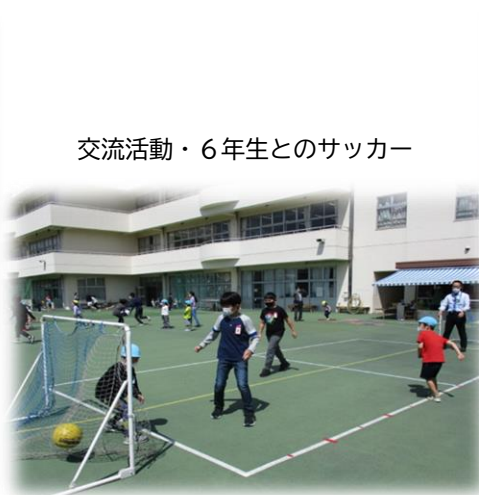
交流活動・6年生とのサッカー