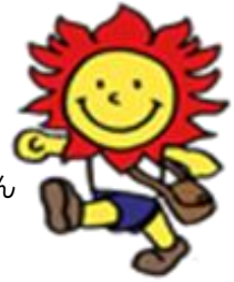
マスコット ほんむらん