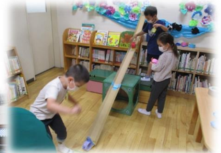
作ったカタツムリで遊ぶ年少児