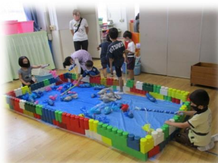
まつりに向けた年長児グループ活動